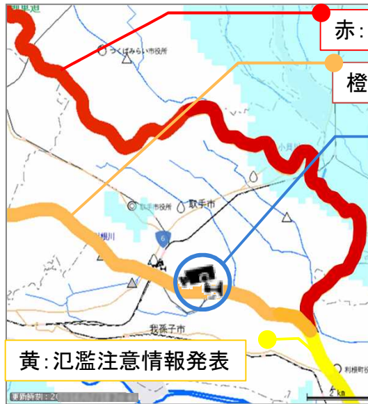
市町村単位での表示