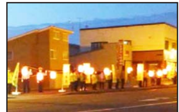
7月13日 富川地区提灯街頭啓発

過去5か年、四輪乗車中の死者 423人中 、シートベルト非着用者は 173人 で、このうち 113人 （6割以上）は着用していれば助かった可能性がありました。