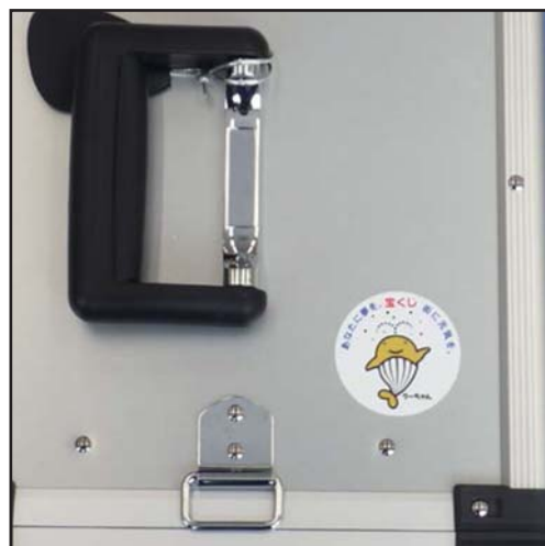
くーちゃんシールを添付