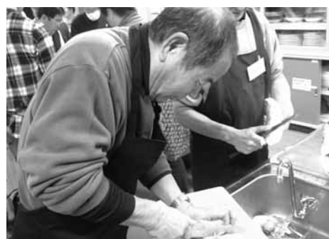
キャベツの千切りに挑戦！