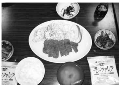
前回はホエー豚のトンカツをつくりました。

※申込期間は平成22年7月27日(火)~平成22年8月20日(金)です。 ただし、定員になり次第締め切ります。