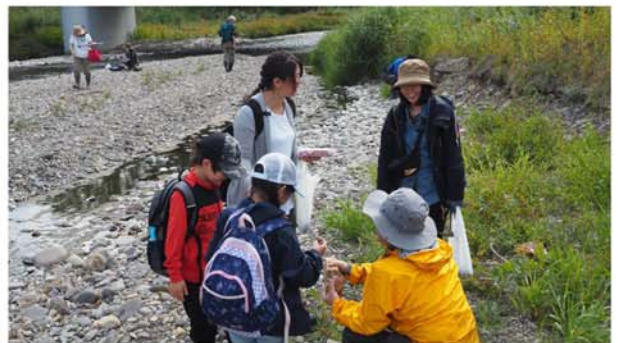
2019年9月22日実施の、とかち鹿追ジオパーク推進協議会から依頼を受けた講座での様子