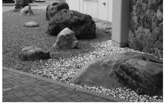
山脈館前の石の庭も、日高の石ころ図鑑になりえます。

今回は、図鑑の作成を参加者にお任せしたのですが、図鑑の作成までを行なって欲しいという意見もいただきましたので、来年は図鑑の作成まで行ないたいと思います。