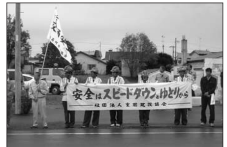
9月21日 建設協会交通安全人波作戦