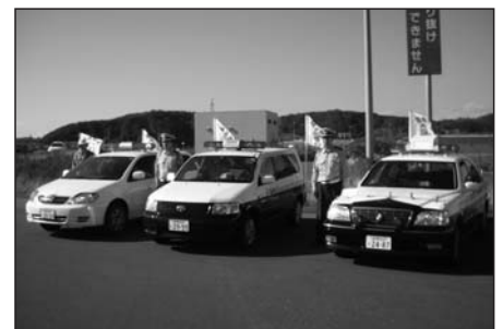
9月30日 日高・平取町合同車両パレード