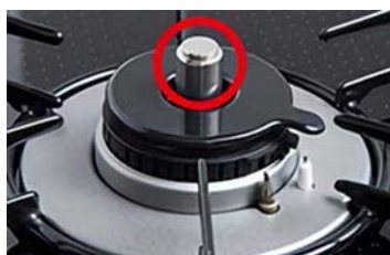
調理油過熱防止装置