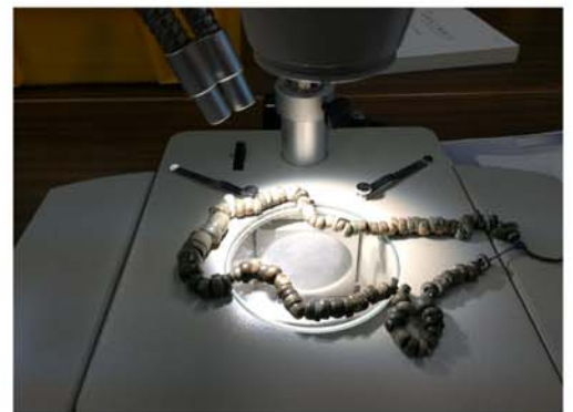
実体顕微鏡による石質鑑定を行ないました。

9月12～14日にかけて、恵庭市郷土資料館から、埋蔵文化財の石質についての鑑定を依頼され、恵庭市郷土資料館にて鑑定を行ないました。縄文時代の遺跡から発掘された埋蔵文化財は、岩石を加工したものが多く、その岩石を明らかにすることで、入手先や現地との交流などを考察する重要な手がかりになるとのことです。恵庭市郷土資料館以外の埋蔵文化財の石質も鑑定しましたが、日高地区周辺でよく見られる岩石が大変多かったのが印象的でした。縄文時代、日高から各地へ材料となる岩石が運ばれていたのかもしれない。