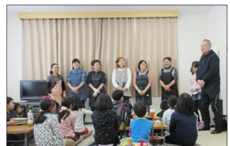
▲地域の方と日高児童仲良しクラブ児童との交流会