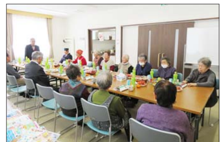
▲千栄老人クラブ新年会