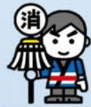
消防団体験ブース