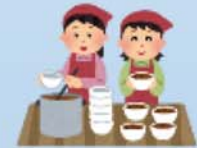
厚賀婦人防火クラブによる炊き出し