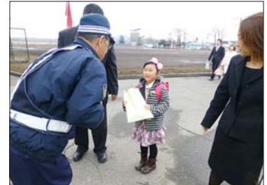
4月7日富川小学校新入生児童交通安全啓発