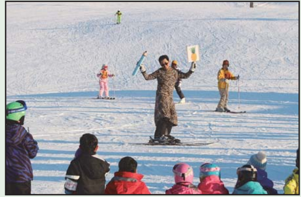
衣装したスキーヤーが奮闘

第2部のポップス・ステージでは、誰もが聞き覚えのある日本を代表する楽曲が披露され、マリンバの小気味良い音色にのせ、観客からは手拍子も聞かれるなど、新春を彩る素敵なコンサートとなりました。