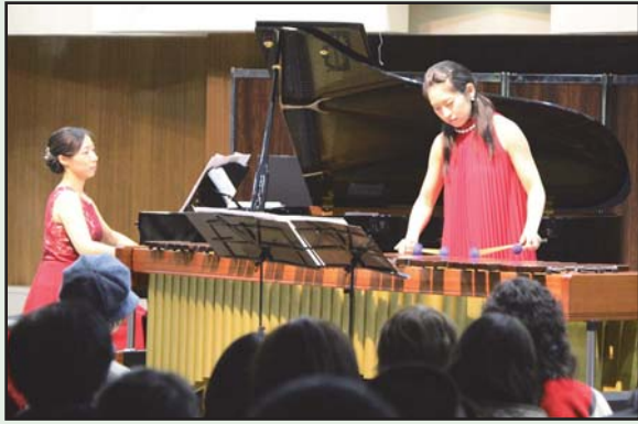
ニューイヤーコンサート2017