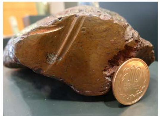
自然銅の断面。銅はやわらかく、岩石カッターでうまく切れないことがあります。