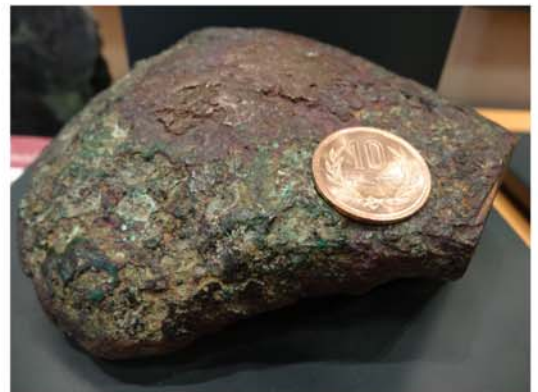
自然銅の表面。孔雀石(緑色)などが見られます。(10円玉はスケール)

生活で利用されている鉱石は、周辺の地質の研究試料としても有用で、その地域での生活と土地柄・地質を結び付けるものとして、かけがえのない価値があります。なお、資料を全て10円玉に加工すると何枚できるのか等、値段について聞かれることが多いのですが、謎にしておきます。