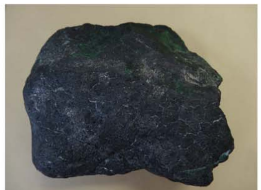
参考資料として、沙流川にて採取したクロム鉄鉱です。

日高山脈博物館のホームページ上でも掲載しています。こちらでは、写真などがカラーとなっています。ぜひご利用下さい。⇒ ホームページ ( http://www.town.hidaka.hokkaido.jp/hmc/ ) の新着情報からどうぞ。