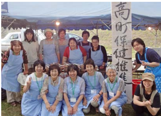
ひだか樹魂まつりでは、つぶ飯の販売をしています