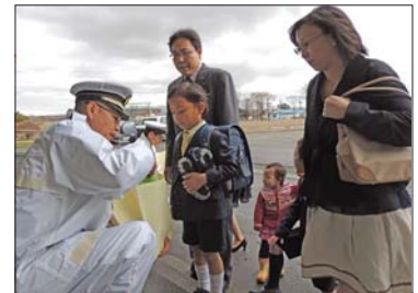
4月8日富川小学校 新入学児童交通安全啓発