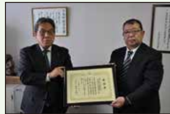
株式会社遠藤組 様