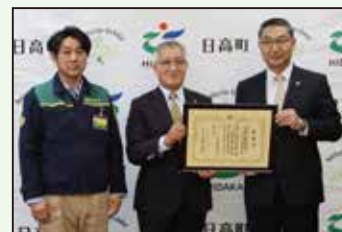
宮坂建設工業株式会社 様