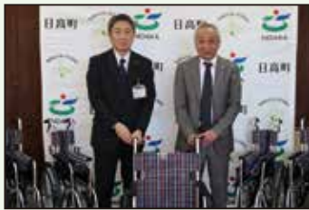
苫小牧地方法人会日高支部 様