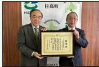
株式会社幸成建設 様