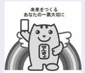
明るい選挙キャラクター 選挙のめいすいくん