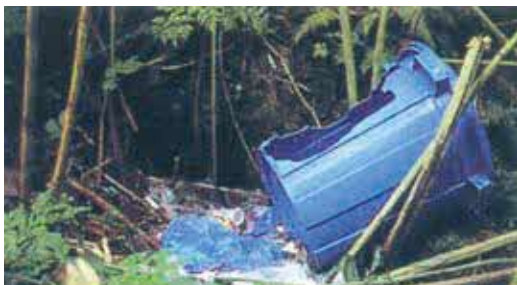
ヒグマに荒らされたゴミバケツ

実際に平成11年～21年度に渡島半島地域で銃器によって捕獲されたヒグマ586個体の胃袋を分析した結果、7.0%に当たる42個体からゴミ袋が出現しました。