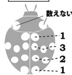
シロジュウシホシテントウ