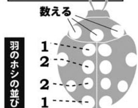
シロジュウゴホシテントウ