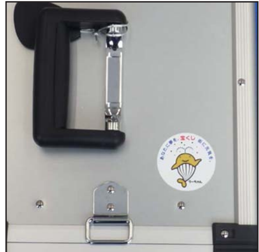
くーちゃんシールを添付