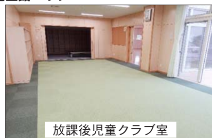
放課後児童クラブ室