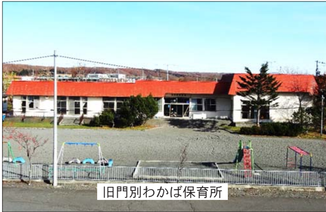
旧門別わかば保育所

昨年7月に着工した門別わかば保育所・もんべつ児童館が完成し、10月22日から利用を開始しました。建物は鉄骨造平屋建てで床面積1,192.16㎡、総事業費は7億7千8百万円。内部は木調にこだわるとともに採光窓を多く取り入れ、ぬくもりのある建物となっています。児童館を新築し保育所と併設することにより、門別本町地区の子育て拠点として期待されるところです。