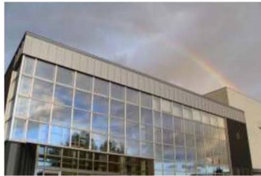
平成27年度使用開始の現校舎