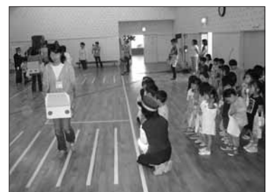
6月24日 こぐまクラブ交通安全教室