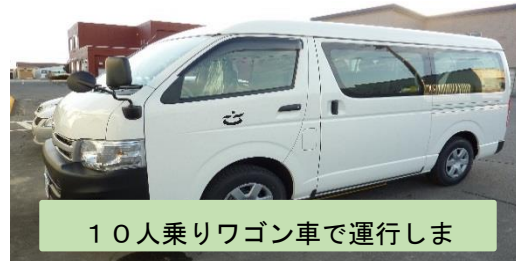
10人乗りワゴン車で運行します