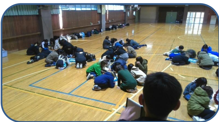
【左上】4年生親子レク 「数字おに」