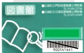
3代目 2006-2013 頃 旧日高町・旧門別町合併時 にできたデザイン