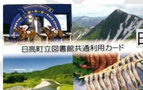
5代目 2020-現在 日高地区と門別地区の特徴が 交差するデザイン

門別図書館の図書館カードは現在5代目！ およそ5～10年くらいでデザインが変わっています。 すべてのデザインのカードが、現在も門別図書館、 日高図書館でご利用いただけます！