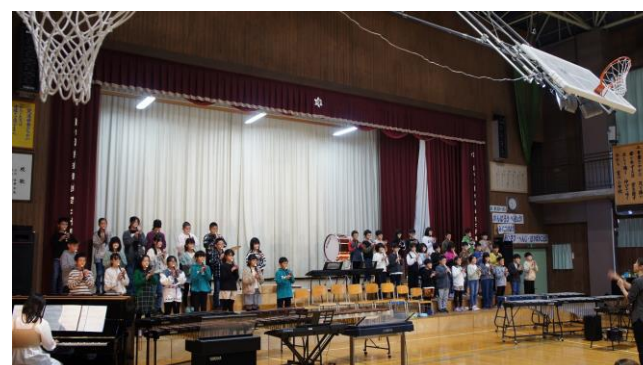
5年生音楽「☆ミュージックスター☆」