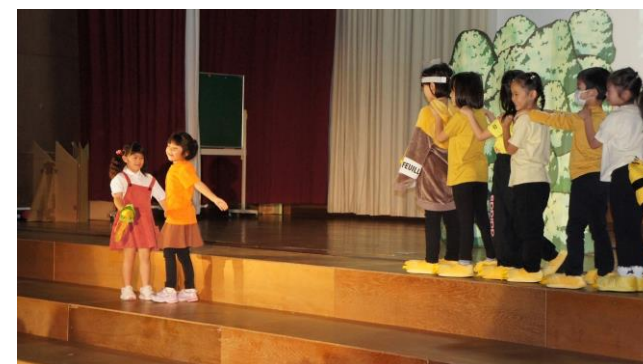
1年生発表「となりのトトロ」

なお、当日の様子はYou tubeの「富小チャンネル」で、後日配信いたしますので、是非ご覧ください。今後も富川小学校へのご支援、ご協力を宜しくお願いいたします。