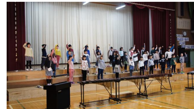
2年生器楽「山の音楽家」