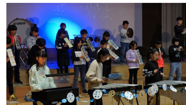
4年生音楽「ソーランWAVE」