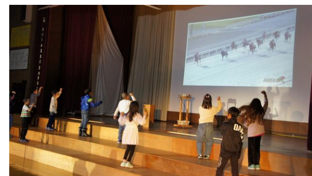
3年生発表「『馬はかせ』をめざして」