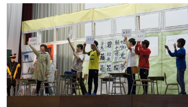
6年生発表「ギャラクシートレイン」