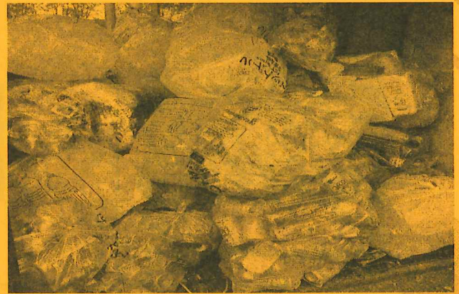
(ごみが混在しているステーション)