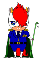
門別警察署 マスコット キャラクター 「門別ナイト」