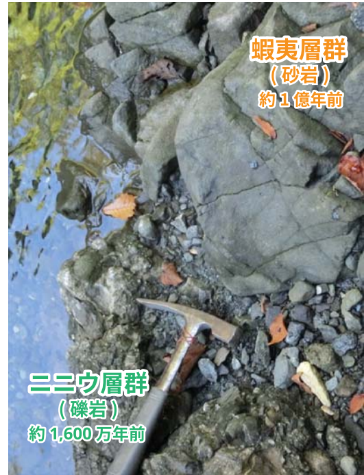
なみだの滝近くで観察される二ニウ層群と蝦夷層群の不整合。ここでは、礫岩（二ニウ層群）と砂岩（蝦夷層群）であるので、見た目にも観察がしやすい。

このジオサイトで観察される二ニウ層群は 1,600 万年ほど前、蝦夷層群は 1 億年ほど前にそれぞれ形成されたと考えられています。この2つの地層の間には、その間に堆積した地層は確認されていません。このように、重なりあう地層の間に、大きく時代の連続性を欠くような状況関係を「不整合」といいます。三号の沢で観察される、二ニウ層群と蝦夷層群の不整合は、およそ 8,000 万年以上という、気の遠くなるような時間の記録が、地殻変動によって失われたことを示しています。この間に起きた出来事としては、 [1] 当時の海（およそ 1 億年前の海。堆積していた場所は、比較的深い海で、「エゾ海盆」とも呼ばれています）の中で、蝦夷層群の地層が堆積する、 [2] 蝦夷層群が堆積していた当時の海が隆起して、堆積していた地層が浸食される（海が陸になった）、 [3] 陸地が再び沈降したことや海進などによって、新たな地層（二ニウ層群）が堆積し始めた、ということが考えられます。