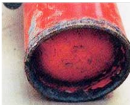
腐食した消火器底

消火器は、万が一火災になった時の初期消火器具として非常に有効ですが、日常の維持管理が適切に行われず、長年放置されたままの状態では、いざという時に効果を発揮しないばかりではなく、破裂事故を起こし重傷を負うことがあります！