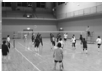
9/21～ レディース 9人制バレーボール