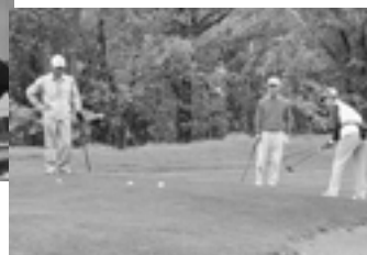
10/6 日高地区 パークゴルフ