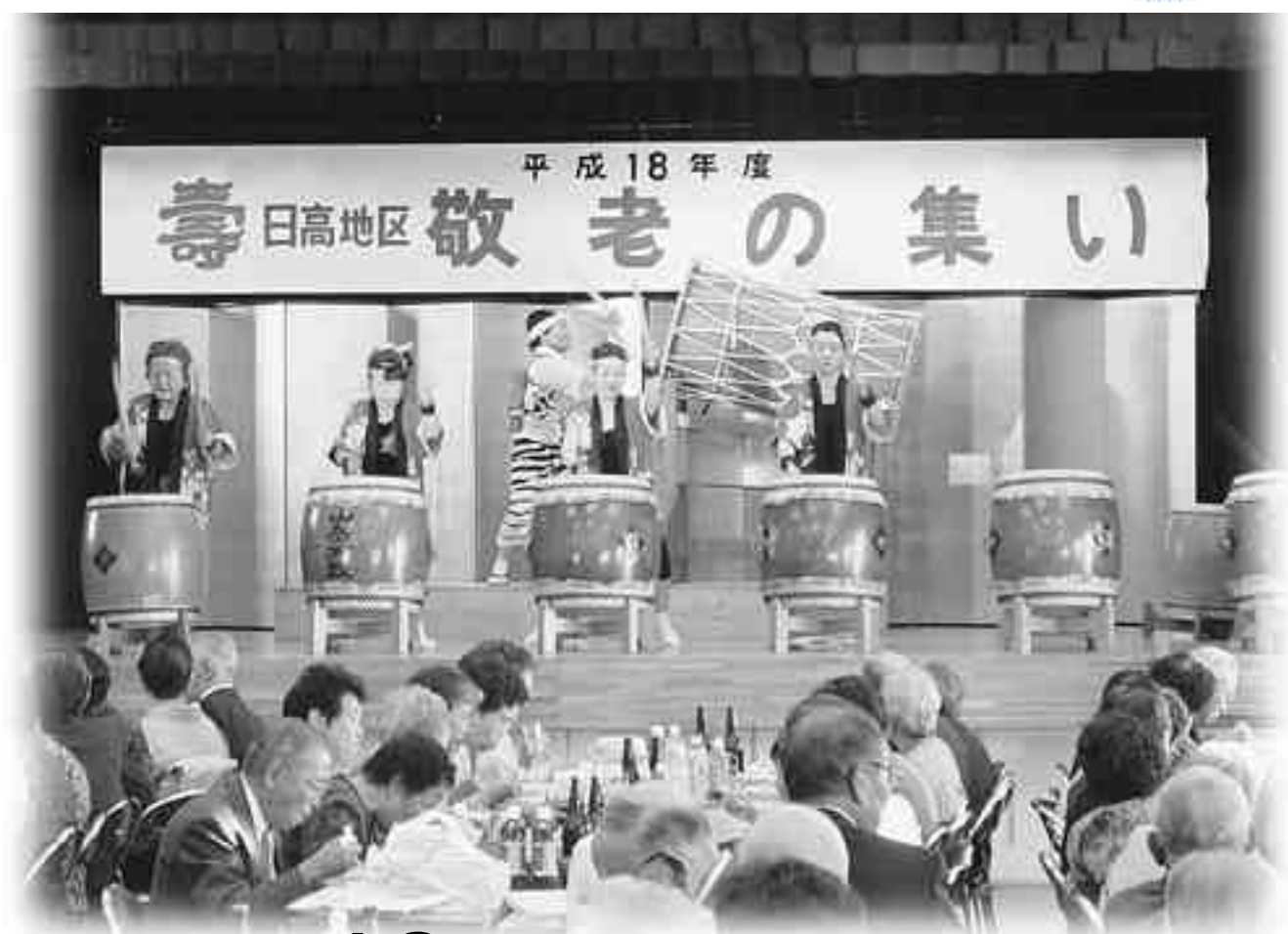
日高地区 敬老の集い(日龍太鼓)