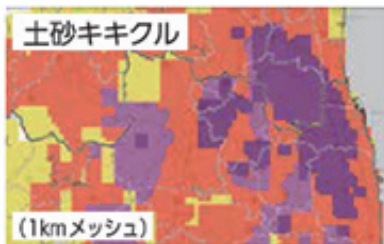
紫：崖・溪流の近くは危険