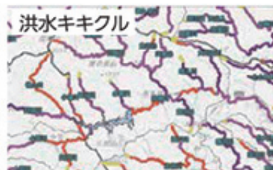
紫：河川沿いは危険

*市区町村単位で発表される情報には、大雨特別警報、土砂災害警戒情報、大雨警報などがあります。